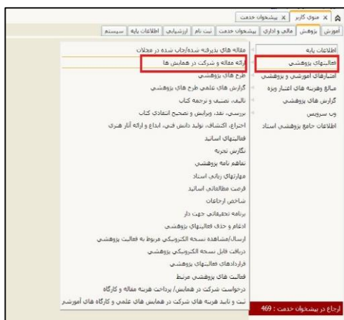
شکل ۲: ثبت مقاله همایش